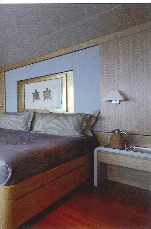
Les aménagements sobres s'associent à des lignes modernes pour ce yacht d'expédition hors du commun.